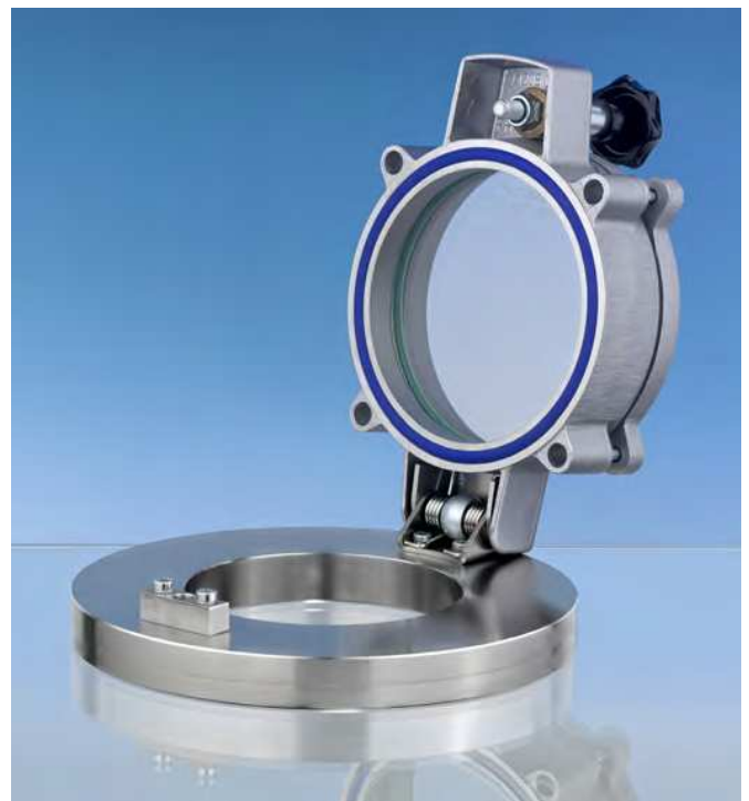
Hublot à ouverture rapide type SKS 150