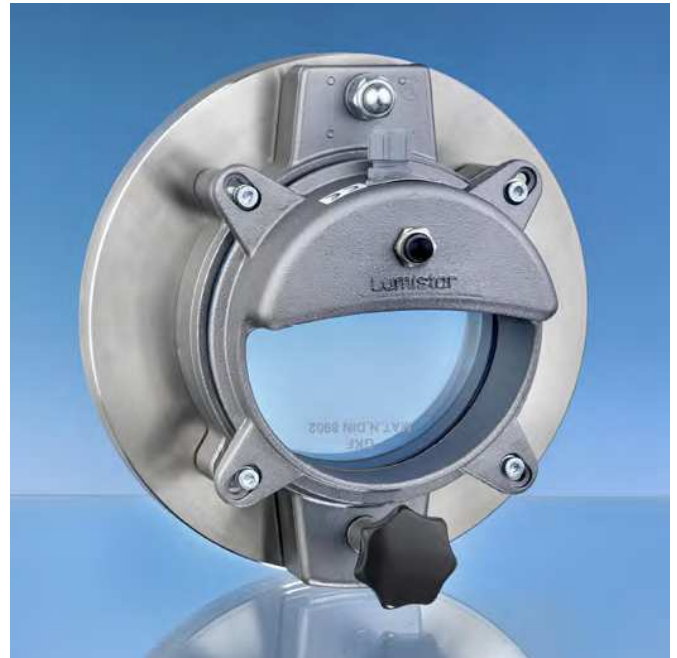
Hublot à ouverture rapide type ESKS