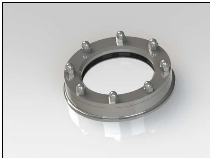
Hublot PHARMA DN150

Usinage de brides spéciales suivant plans.