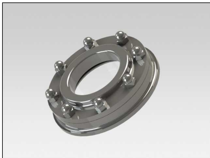
Hublot PHARMA LED DN100