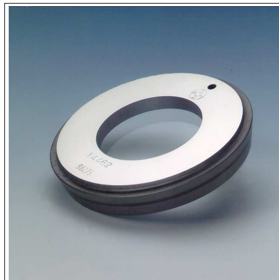
Bague-hublot Metaglas pour raccord DIN 11851