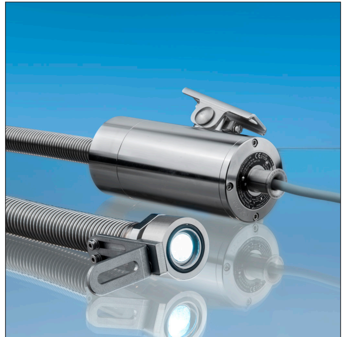
LProjecteur 'Lumiflex' ESL55LED-ALF-Ex