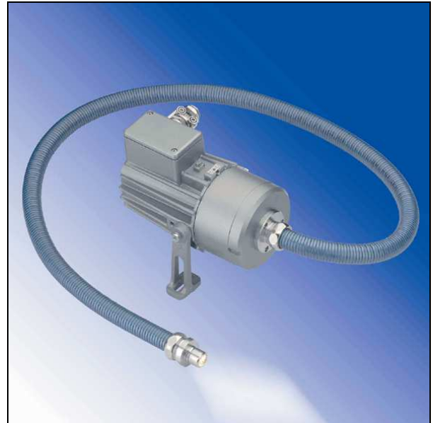
Projecteur à fibre optique lumiflex