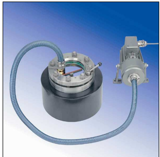
Projecteur lumiflex Ex, monté sur hublot 28120 en combinaison avec un essuie-glace.