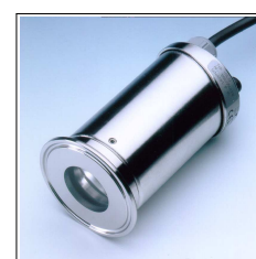
Projecteur USL35LED avec bague - hublot Metaglas pour montage aseptique