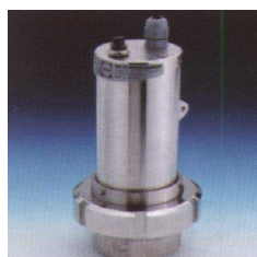
Projecteur USL15LED monté Sur hublot type MV50 avec Manchon adaptation