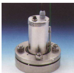
Projecteur USL15LED monté sur hublot 28120 avec une charnière

Possibilité d'un temporisateur incorporé pour le projecteur USL15 / 35 pour une alimentation en 24V.