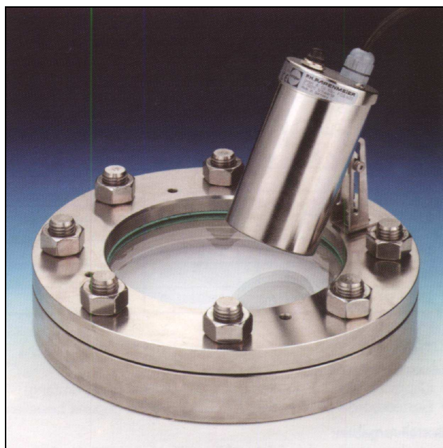
Projecteur USL 15LED avec charnière monté sur un hublot 28120.