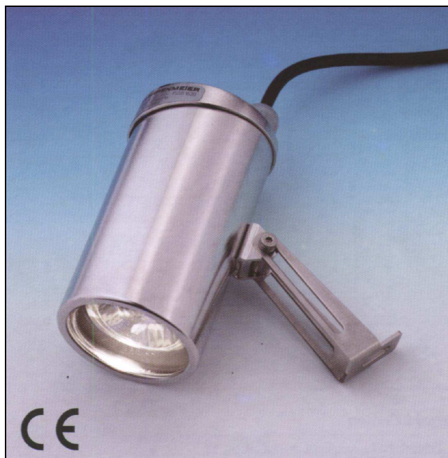
Projecteur USL 15LED

Le projecteur USL35 est conçu pour un montage aseptique sur bague-hublot METAGLAS ou sur manchon spécial aseptique.