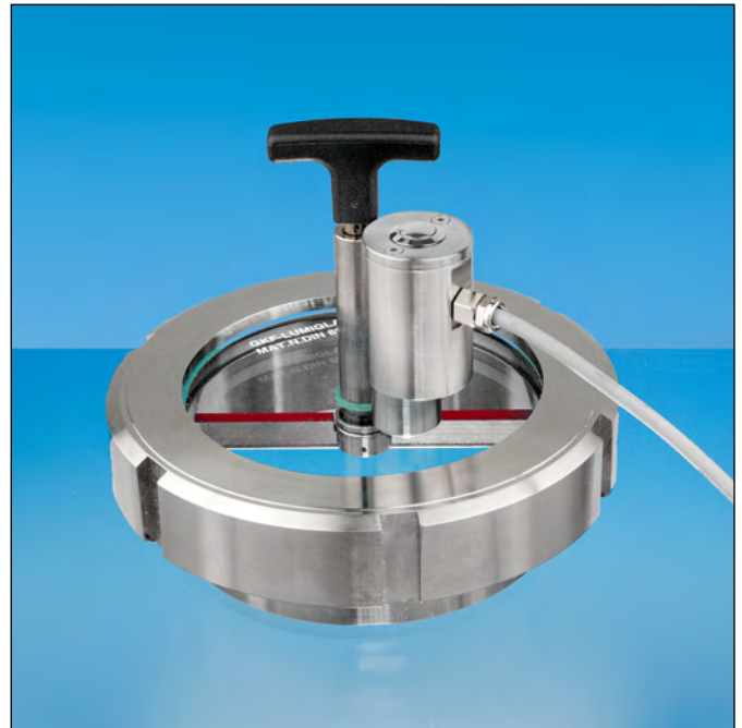
Lumistar luminaire ESL 51-LED-HK installé sur hublot à visser MV avec essuie-glace EG1T