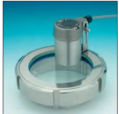
Combinaison éclairage - observation sur un hublot DIN 11851 DN 100