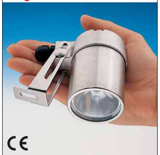
Montage d'un projecteur USL03 avec charnière