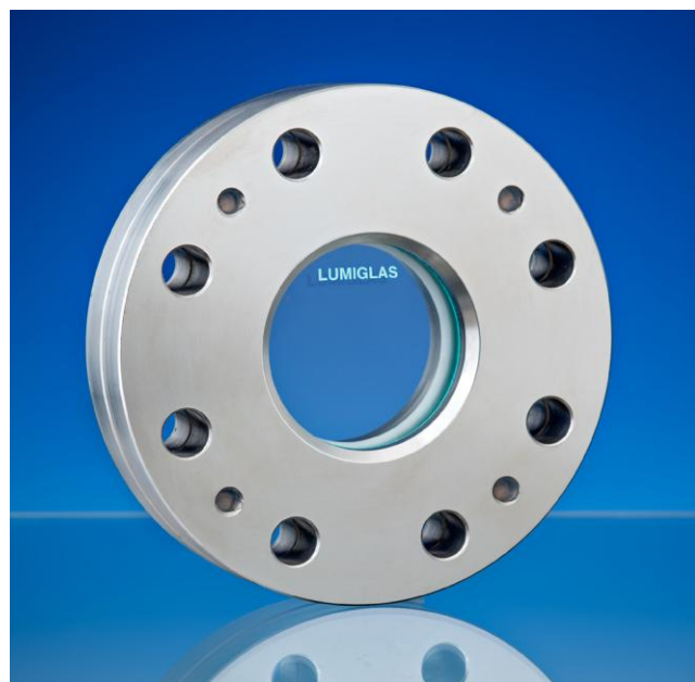
Hublot DIN 28121

Utilisez les boulons de fixation appropriés, dont le nombre et la taille sont indiqués sur le tableau au verso, pour monter l'unité prête à être pré-comprimée et scellée sur la bride.