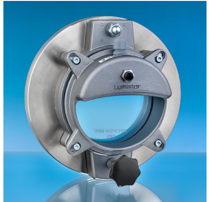
Hublot à ouverture rapide type ESKS