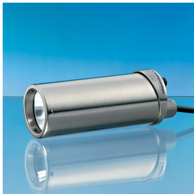
Projecteur USL 33 LED