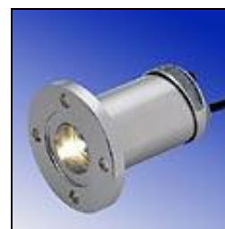
Projecteur USL 33LED monté sur contre-bride hublot Metaglas