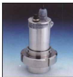
Projecteur USL 13LED monté sur hublot à visser MV50 avec manchon d'adaptation