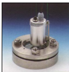
Projecteur USL 13LED monté sur hublot DIN 28120 avec charnière