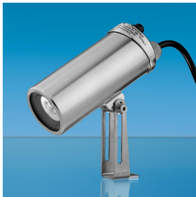
Projecteur USL 13 LED

Le projecteur USL33 est conçu pour un montage aseptique sur embout METAGLAS ou manchon spécial